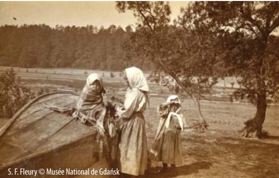
S. F. Fleury © Musée National de Gdańsk

Nous présentons simultanément deux expositions de photographie :