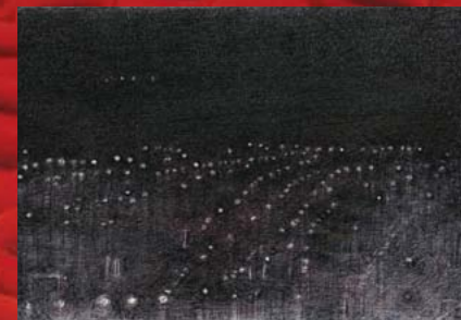
Yola Yolski, Logan Airport II , encre sur papier

« Pour la première fois j'ai décidé de dévoiler le fonctionnement intime de mon travail de peintre. Quotidiennement, je dessine à chaque occasion ce qui accroche mon regard, une forme, une lumière, un espace, parfois je tente de capter une situation. Ces images, une fois notées sur le papier, prennent une consistance nouvelle dans mon univers mental et je peux alors les simplifier ou les transformer au gré de mes pensées. Ma peinture est le produit de cette maturation qui conduit de la réalité observée à la simplification ou à la transposition conceptuelle. » (Yola Yolski) Exposition dédiée à Michel Bourgeois.