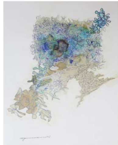
Witold Januszewski, Collection privée