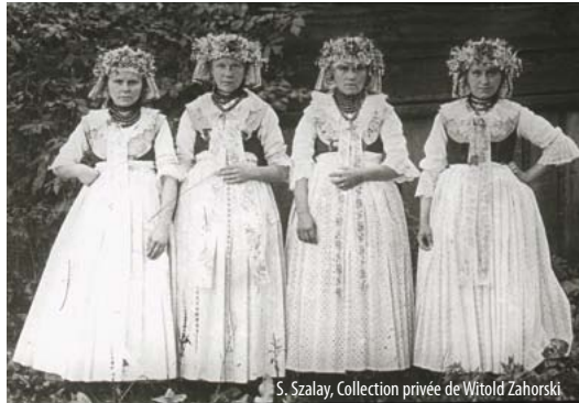
S. Szalay, Collection privée de Witold Zahorski