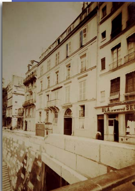
Façade de la BPP au début du XX e s.