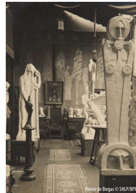
Atelier de Biegas

DU 1 er AU 31 OCTOBRE 2014 | vernissage : mardi 30 septembre à 19h00