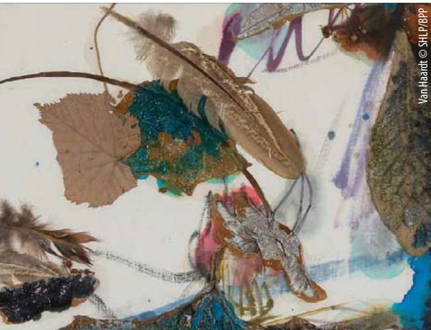
Van Haardt

Nous présentons simultanément deux expositions :