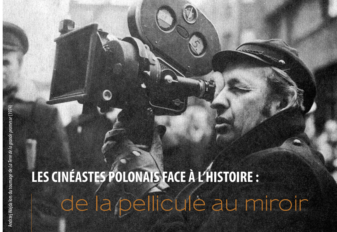
Andrzej Wajda lors du tournage de La Terre de la grande promesse (1974)